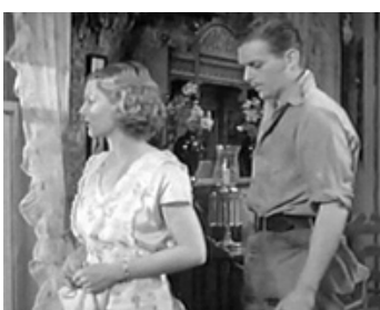
1933 LA DEUXIÈME AURORE (The Life of Jimmy Dolan) de Archie Mayo avec Loretta Young