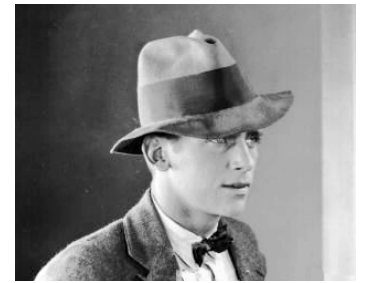
1926 BROKEN HEARTS OF HOLLYWOOD de Lloyd Bakon avec Louise Dresser