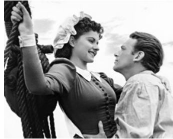
1939 LES MAÎTRES DE LA MER (Rulers of the Sea) de Frank Lloyd avec Margaret Lockwood