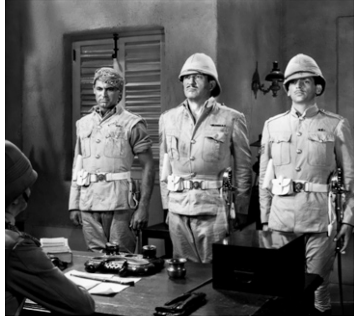
1939 GUNGA DIN (Gunga Din) de George Stevens avec Cary Grant, Victor McLaglen