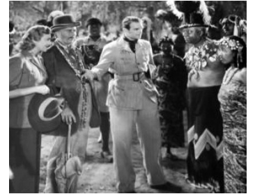
1940 SAFARI (Safari) d'Edward H. Griffith avec Madeleine Carroll