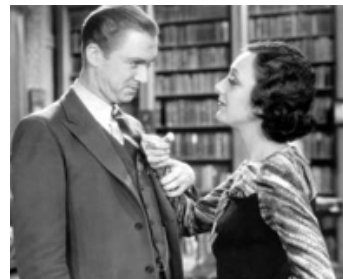
1932 L'AMOUR EN VITESSE (Love is a Racket) de William Wellman avec Ann Dvorak