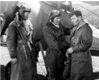
1930 LA PATROUILLE DE L'AUBE (The dawn Patrol) de Howard Hawks avec R. Barthelme