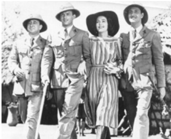
1939 FRÈRES HÉROÏQUES (The Sun never sets) de R; V. Lee avec Basil Rathbone, Barbara O'Neill