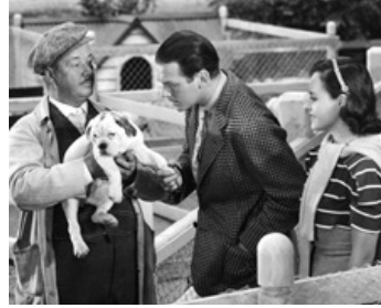
1938 LA FAMILLE SANS SOUCI (The Young in Heart) de J. Cromwell avec Paulette Goddard