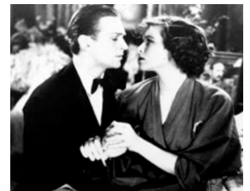
1933 MATIN DE GLOIRE (Morning Glory) de Lowell Sherman avec Katharine Hepburn