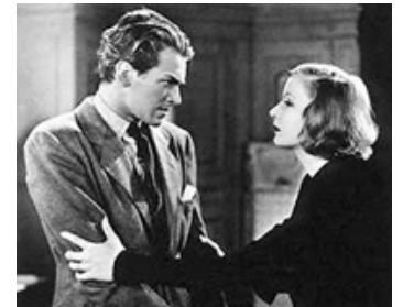
1929 INTRIGUES (A Woman of Affairs) de Clarence Brown avec Greta Garbo