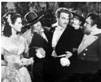
1941 VENDETTA (The Corsican Brothers) de Gregory Ratoff avec Ruth Warrick