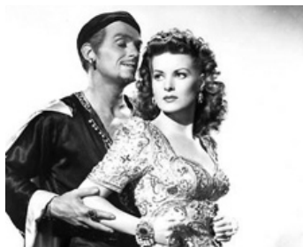
1946 SINBAD LE MARIN (Sinbad the Sailor) de Richard Wallace avec Maureen O'Hara