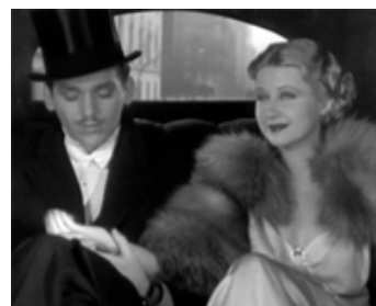
1934 LE SUCCÈS À TOUT PRIX (Success at any Price) de J. Walter Ruben avec Genevieve Tobin