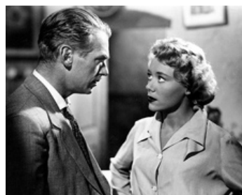
1950 SECRET D'ÉTAT (State Secret) de Sidney Gilliat avec Glynis Johns