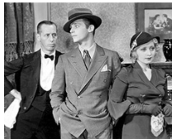
1932 GARE CENTRALE (Union Depot) d'Alfred E. Green avec Joan Blondell