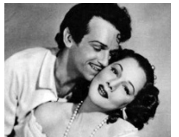
1947 L'ÉXILÉ (The Exile) de Max Ophüls avec Maria Montez