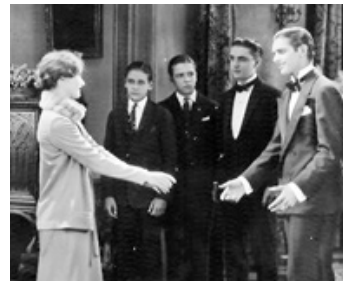
1925 STELLA DALLAS (Stella Dallas) de Henry King avec Lois Moran