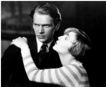
1928 FORAINS (The Barker) de George Fitzmaurice avec Dorothy Mackaill