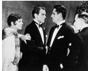
1928 MODERN MOTHERS de Phil Rosen avec Helen Chadwick