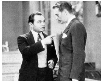
1930 LE PETIT CÉSAR (The Little Caesar) de Mervyn Le Roy avec Edward G. Robinson