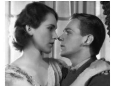
1931 CHANCES (Changes) d'Allan Dwan avec Rose Hobart