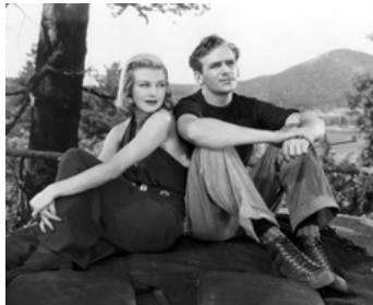
1938 VACANCES PAYÉES (Having a Wonderful Time) d'Alfred Santell avec Ginger Rogers