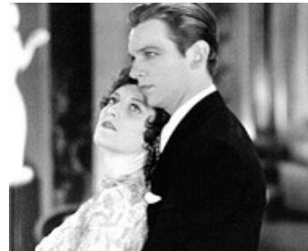
1929 JEUNES FILLES MODERNES (Our modern Maidens) de Jack Conway avec Joan Crawford