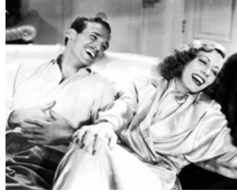
1938 QUELLE JOIE DE VIVRE (Joy of Living) de Tay Garnett avec Tay Garnett avec Irene Dunne