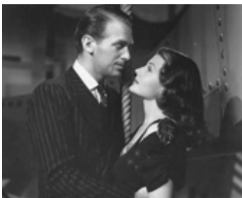
1940 L'ANGE DE BROADWAY (Angels over Broadway) de Ben Hecht et Lee Garmes avec Rita Hayworth