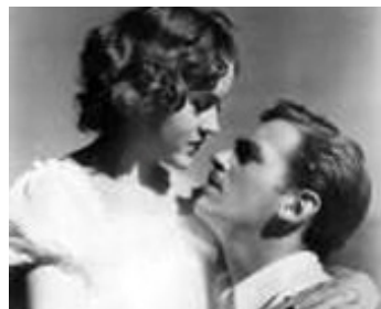
1933 UN COIN TRANQUILLE (The Narrow Corner) d'Alfred E. Green avec Patricia Ellis