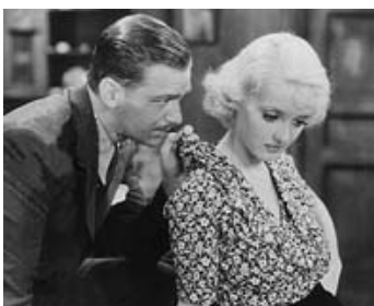
1933 PARACHUTE JUMPER d'Alfred E. Green avec Bette Davis