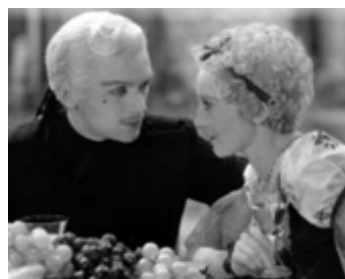
1933 CATHERINE DE RUSSIE (The Rise of Catherine the Great) de P. Czinner avec E. Bergner