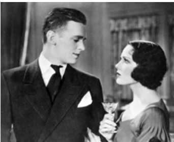
1931 IT'S TOUGH TO BE FAMOUS de Alfred E. Green avec Mary Brian