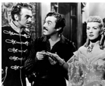
1947 LA DAME AU MANTEAU D'HERMINE (This Lady in Ermine) d'E. Lubitsch avec Betty Grable