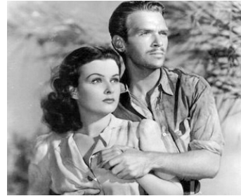
1940 L'ENFER VERT (The Green Hell) de James Whale avec Joan Bennett