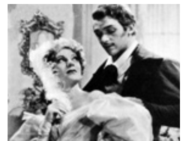
1935 MIMI (Mimi) de Paul Stein avec Gertrude Lawrence