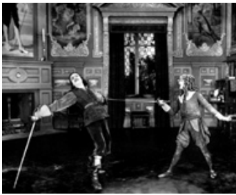
1921 LES TROIS MOUSQUETAIRES (The three Musketeers) de F. Niblo avec Marguerite de La Motte