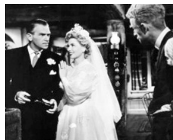
1950 LE CANARD ATOMIQUE (Mr Drake's Duke) de Val Guest