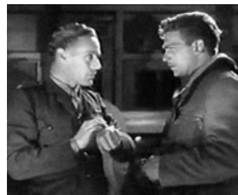
1933 CAPTURÉ (Captured) de Roy del Ruth avec Leslie Howard