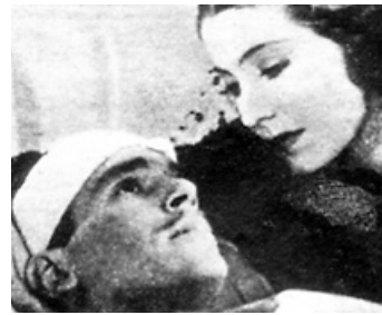
1937 LES DEUX AVENTURIERS (Jump for Glory) de Raoul Walsh avec Valerie Hobson