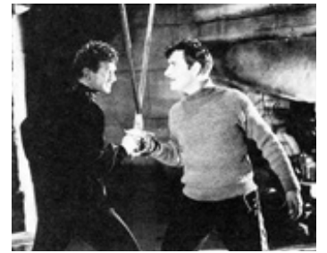
1937 LE PRISONNIER DE ZENDA (The Prisoner of Zenda) de J. Cromwell avec Ronald Colman