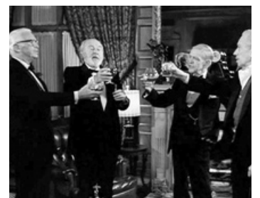
1981 LE FANTÔME DE MILBURN (Ghost Story) de John Irvin avec Fred Astaire