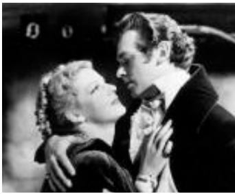
1936 LE GENTILHOMME AMATEUR (The Amateur Gentleman) de Th. Freeland avec Elissa Landi