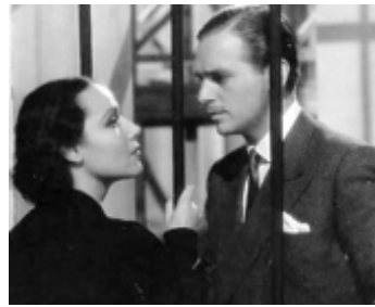
1936 LE DANGER D'AIMER (Accused) de Thornton Freeland avec Dolores del Rio