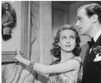
1938 LA COQUELUCHE DE PARIS (The Rage of Paris) de Henry Koster avec Danielle Darrieux